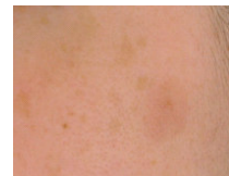
nach ca. 12 Wochen