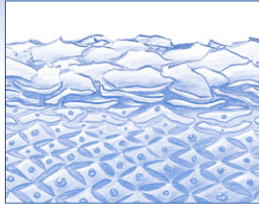
Gestörte Schutzbarriere durch z.B. häufiges Waschen

so sehr gestört werden, dass die natürliche Regeneration nur langsam erfolgt. Sie bemerken die Schädigung der Hautschutzbarriere daran, dass sich Ihre Haut rau und trocken anfühlt, spannt oder Risse entstehen.