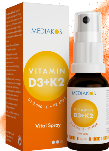
MEDIAKOS Vitamin D3 + K2 2.000 I.E. / 40 µg. Vital Spray Inhalt: 20 ml. PZN: 18096710